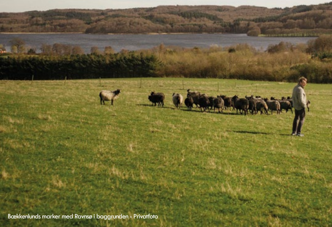
Bækkenlunds marker med Ravn Sø i baggrunden

det sig, at dyrene i vid udstrækning blev passet af ukrainske "gæstarbejdere", der har boet her i landet med deres familier i årevis, og som nu straks må rejse "hjem". Det drejer sig måske ikke om meget mere end tusind mennesker, men deres skæbne minder os om, at langt flere såkaldte østarbejdere i landbrugsindustrien befinder sig i en lignende situation, uden de rettigheder, løn- og arbejdsforhold, som "rigtige danskere" ellers betragter som en selvfølge.