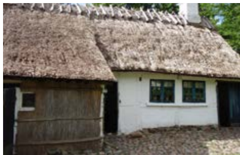
Typisk landarbejderhus fra Englerup ved Roskilde omkring år 1900 Genopført på Frilandsmuseet i Sorgenfri 1951

til det. Men samtidig begyndte en voksende bekymring at ramme beslutningstagere, godsejere og landmænd. For den stigende afvandring fra land til by, betød både bolig-mangel og arbejdsløshed i byerne, ligesom