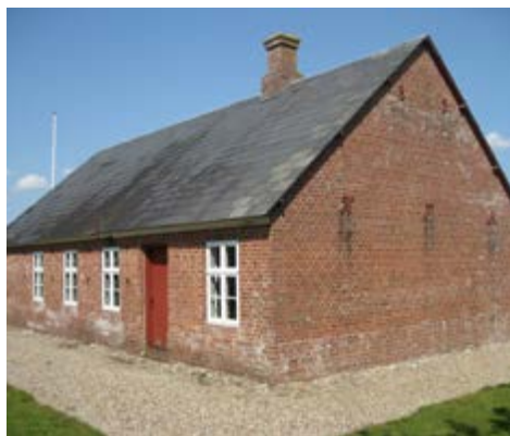
Det første andelsmejeri Hjedding Andelsmejeri er i dag mejerimuseum.

flytte korn over større afstande. Landbruget kom i krise. Samtidig steg befolkningstallet, og der var brug for flere fødevarer. Produktionen var primært lagt an på egen forarbejdning, men i 1882 kom det første andelsmejeri i Hjedding ved Ølgod i Sydvestjylland. Her fik både godsejer, gårdmand og husmand lige stor indflydelse. Vi fik princippet en mand – en stemme. Senere fulgte flere mejerier, og vi