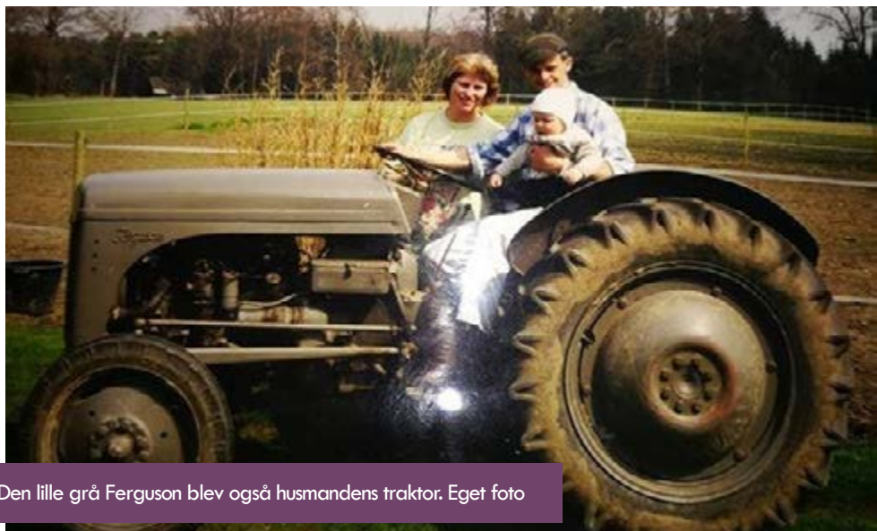
Den lille grå Ferguson blev også husmandens traktor.

Dermed bidrog den danske landbrugsproduktion direkte til den tyske krigsøkonomi. Inden besættelsen var Storbritannien det største marked for den betydelige danske landbrugseksport, idet stort set hele baconeksporten og omkring 75% af smøreksperten blev solgt på dette marked.